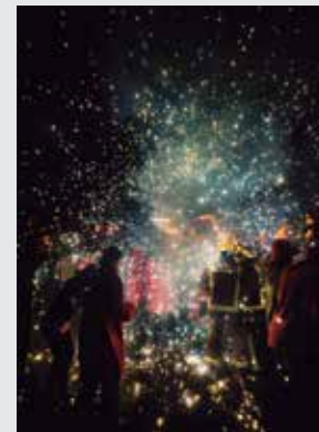
Jordi Forés premi d'honor 2013